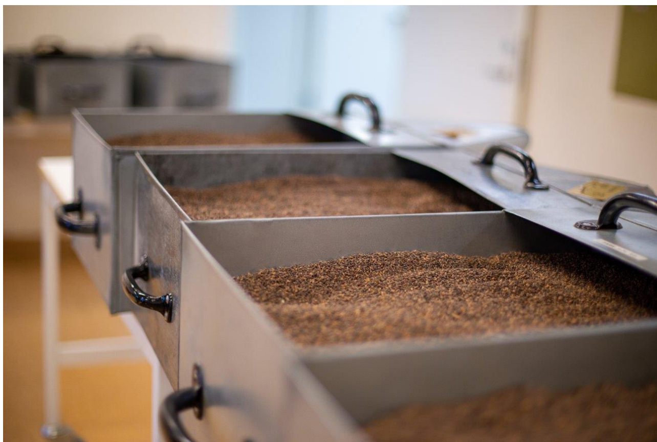
Sorterat tallfrö från en fröodling